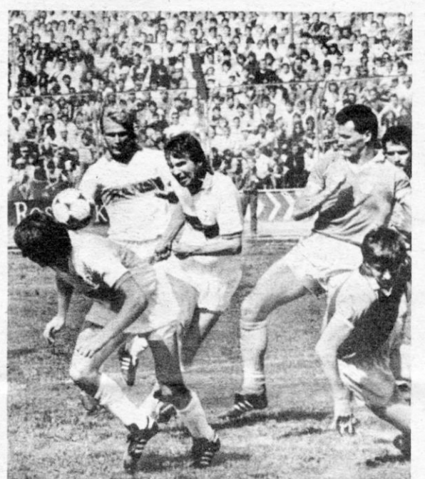
Eng, enger, am engsten ging es oft im Strafraum der Zwickauer zu. Auch für Routinier Jarohs gibt es bei seinem Schuß kein Durchkommen.