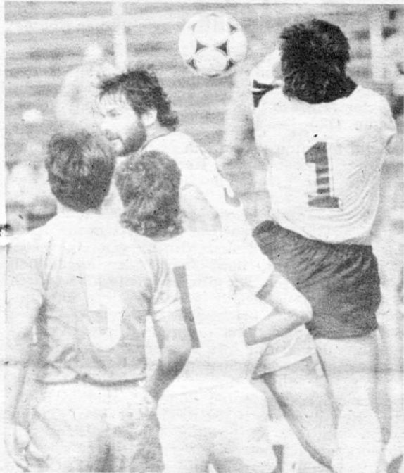
Oft geriet Union-Schlußmann Lihsa in Bedrängnis, hier durch FCM-Libero Stahmann und Angreifer Rösler. Fischer ist der Beobachter.

Abschied mit Anstand? Ich kann mir nicht vorstellen (nach den zweiten 45 Minuten jedenfalls nicht), daß der FCK am Schlußtag gegen Cottbus diese Chance in den Wind schlägt.