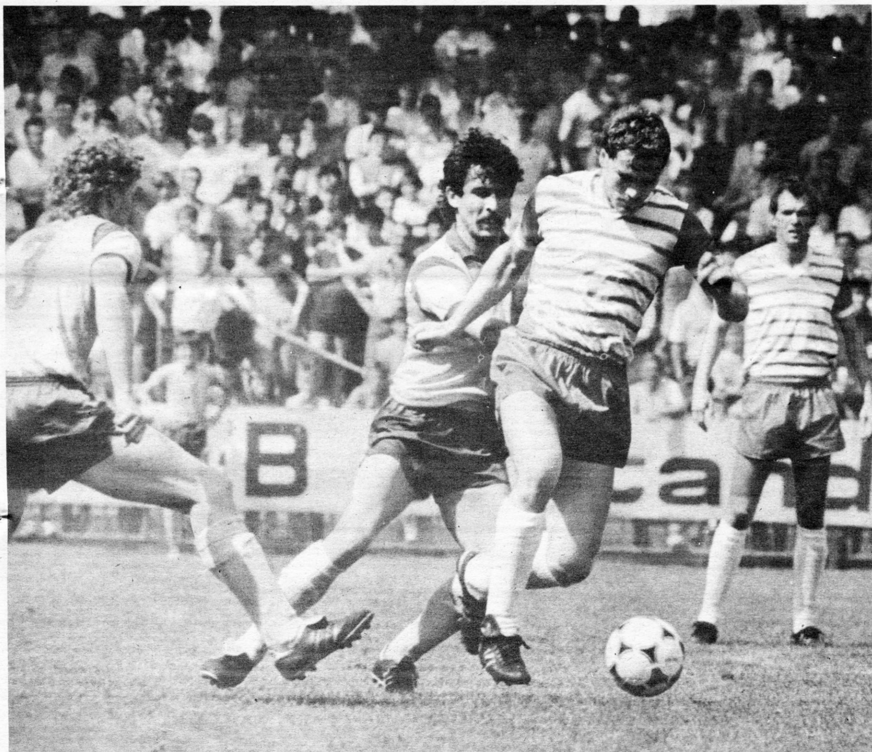
Der Cottbuser Melzig, hier gegen Kracht und Halata (r.), wie seine Energieelf auf dem Vormarsch

Drei Mannschaften können sich noch Chancen auf eine UEFA-Cup-Teilnahme ausrechnen ● Der FC Hansa und der FCK sind dabei in Vorhand, der FC Carl Zeiss muß auf Schrittmacherdienste hoffen ● Seit Mittwoch stehen die Absteiger fest: Sachsenring Zwickau, 1.FC Union Berlin